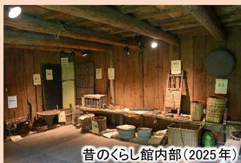
昔のくらし館内部(2025年)