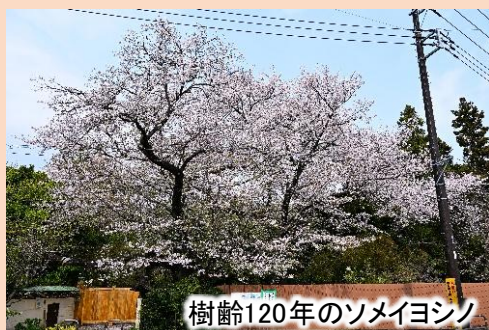
樹齢120年のソメイヨシノ

関家は幸谷村曲淵氏知行地の名主をつとめ、江戸時代に建てられた門や蔵、古文書や昔の生活用品が今も保存されています。生活用品は蔵を改修して展示。このたび「昔のくらし館」として、リニューアルします。また、古文書は新松戸のタウン誌『月刊新松戸』に「関さんの蔵通信」として2012年から連載。これを整理してまとめた『関家の古文書をよむー関さんの蔵通信 100号誌ー』を発刊しました。満開の桜のもと、江戸時代の幸谷村の人々の暮らしに思いを馳せてみませんか。